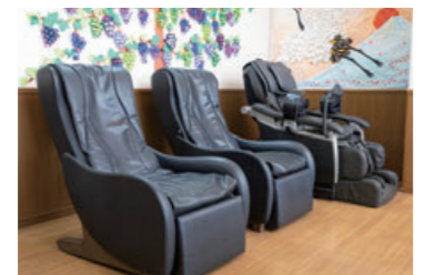
心も体もほぐすマッサージチェア。