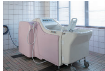
リフト浴・機械浴も完備。車椅子の方もご安心ください。