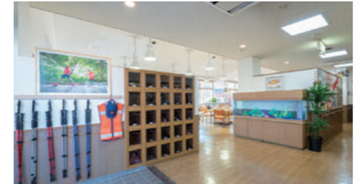
玄関では大きな水槽の熱帯魚たちがお出迎え。