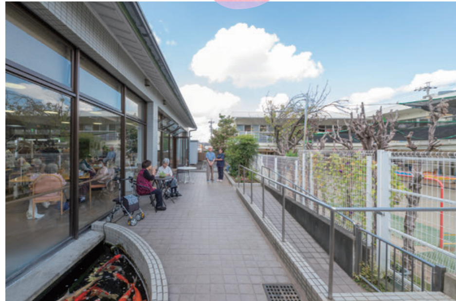
広いテラスで池の鯉を眺めたり、お隣の保育園で遊ぶ子どもの姿に癒されながらゆったりとした時が流れます。スロープや手すりで行歩リハビリも。