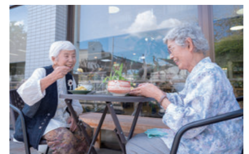
気候の良い季節にはテラスでおやつ。コーヒー、紅茶の他にも抹茶もあり、無料サービスで喜んでいただいております。