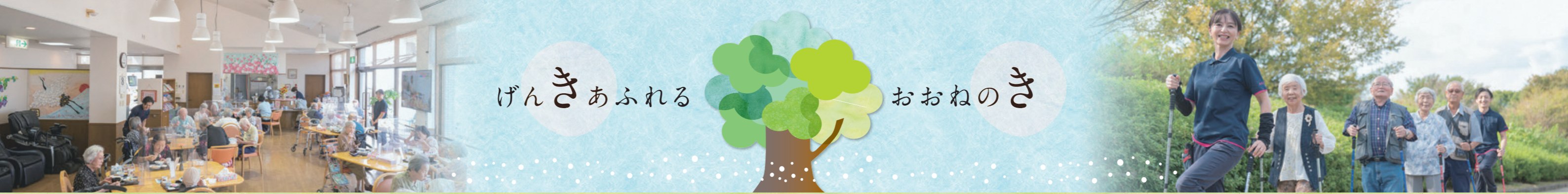
光あふれる大きなガラス窓。高い天井の、広々とした空間。