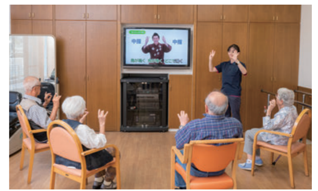
元気に気持ちを盛り上げながら安全に配慮しスタッフが一緒に楽しく行います。