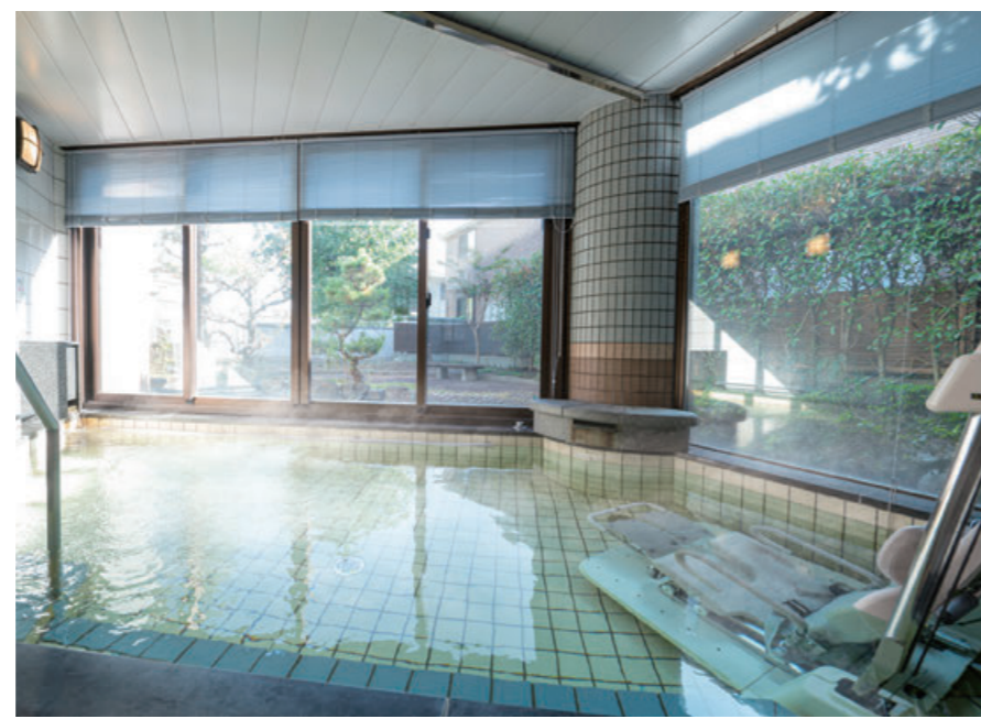
池に泳ぐ錦鯉を眺めながら入浴。手足が伸ばせるゆったり大きな展望風呂。