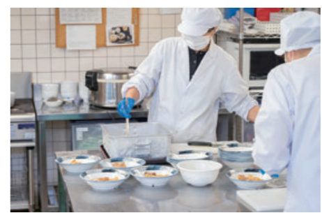
高齢者に必要な栄養管理と、四季折々の色彩や味わいを生かした献立。センター内の厨房で、温かな昼膳をご用意します。