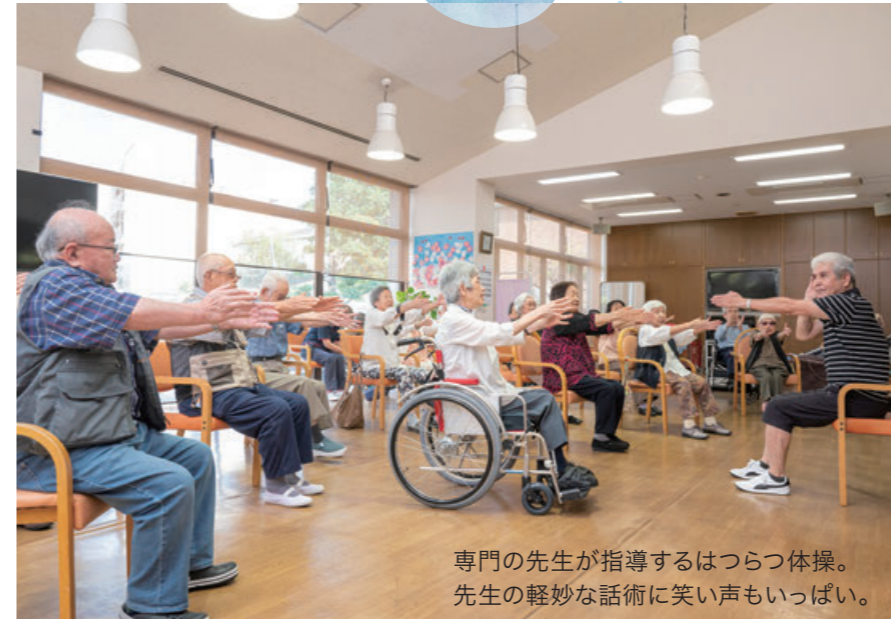
専門の先生が指導するはつらつ体操。先生の軽妙な話術に笑い声もいっぱい。

お一人おひとりに合わせたプログラムを作成。積極的に体を動かす時間を作り、健康な心と体作りをお手伝いします。